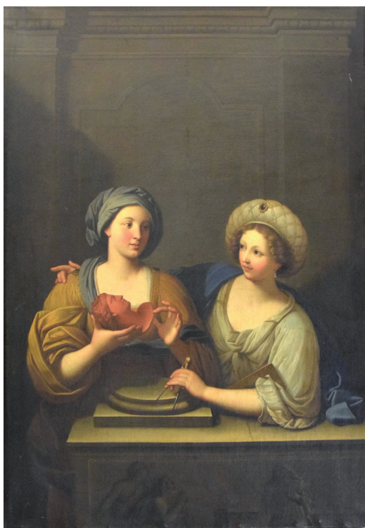
Guido Reni (d'après), L'Union de la sculpture et de l'architecture , musée d'Art et d'Archéologie, Senlis.

- Nathalie Volle, Christophe Brouard (dir.), Heures italiennes. Trésors méconnus de la peinture italienne en Picardie , Amiens, Beauvais, Compiègne, Chantilly, mars-juillet 2017, Picardie, Snoeck, 2017.