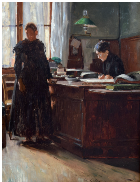
É. Gelhay, Étude préparatoire pour le tableau Aux Enfants-Assistés : L'abandon (détail)

- Daniel LOLSTEIN, Des plaines à l'usine. Images du travail dans la peinture française de 1870 à 1914 . Chapitre « L'appel aux larmes. De la représentation des laissés-pour-compte de l'industrialisation dans la peinture des Salons officiels, 1879-1914 », n° 92, p. 88.