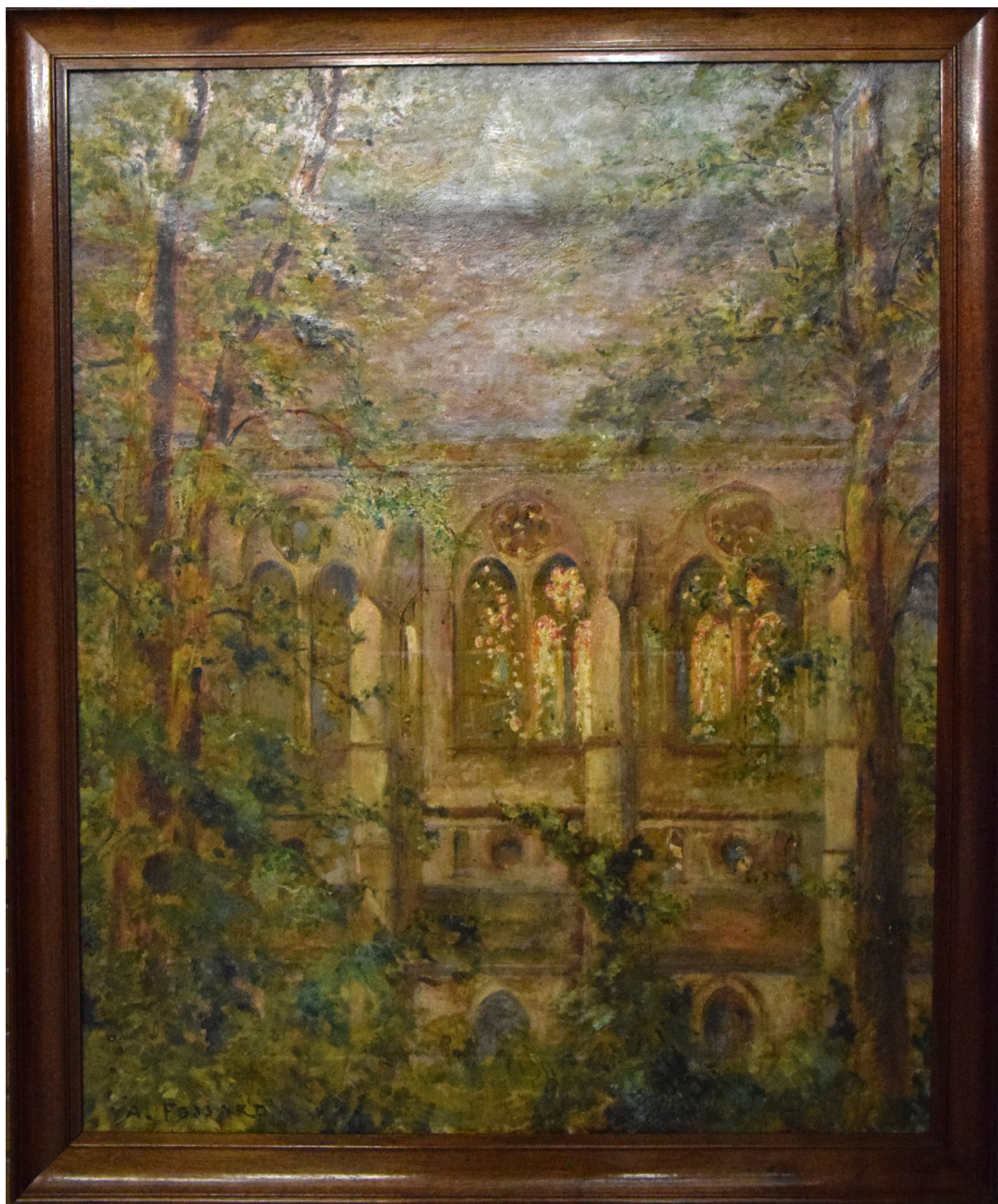
Albert Fossard (? 1864 - ?, 1947) Aurore à Saint-Leu-d'Esserent Huile sur toile, 1938