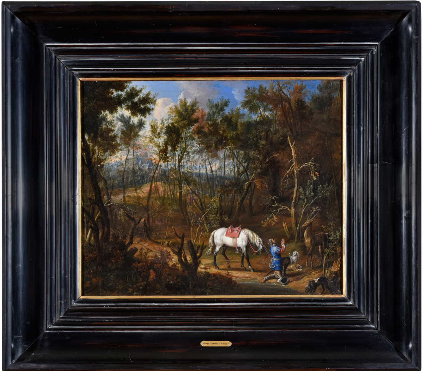
Anonyme Vision de saint Hubert Huile sur toile, XVII e siècle